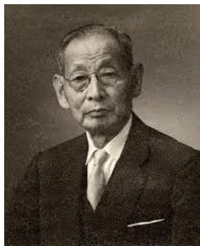
三島海雲 カルピス創業者