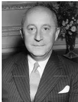
クリスチャン ディオール ファッションデザイナー